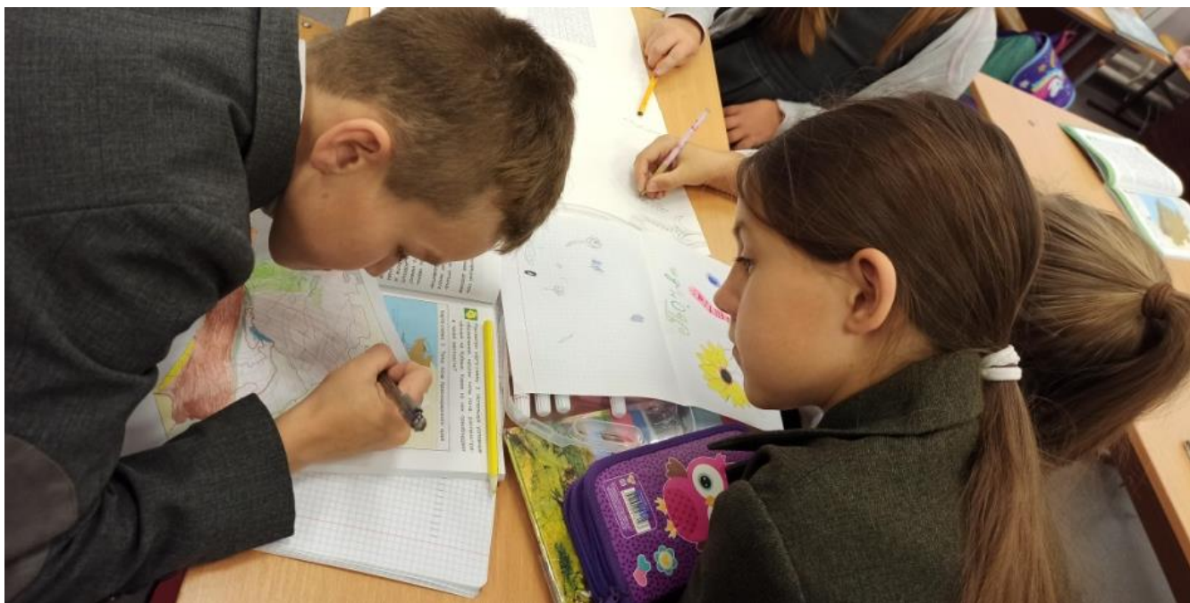
Обучающиеся 4 В класса работают над проектом